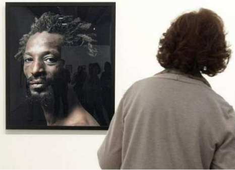
El testimonio del mejor arte contemporáneo de la colección de Pilar Citoler en Zaragoza

Zaragoza, 29 may (EFE).- Un total de 169 obras de la colección Circa XX, de 135 artistas como Picasso, Miró o Le Corbusier, se exponen en el museo Pablo Serrano de Zaragoza, como un testimonio del arte contemporáneo del siglo XX y principios del XXI y que refleja la pasión de Pilar Citoler por el coleccionismo.