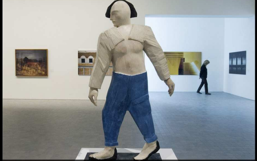
Una obra de la exposición titulada "Pilar Citoler: Coleccionar, una pasión en el tiempo" que se exhibe en el museo Pablo Serrano de Zaragoza y que reúne un total de 160 obras de la colección Circa XX, de 135 artistas como Picasso, Miró, Le Corbusier, Cartier-Bresson, Mapplethorpe o García-Rodero, como un testimonio del arte contemporáneo del siglo XX y principios del XXI.