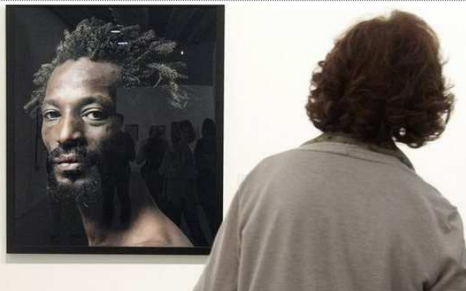
El testimonio del mejor arte contemporáneo en una gran muestra en Zaragoza

Un total de 169 obras de la colección Circa XX, de 135 artistas como Picasso, Miró o Le Corbusier, se exponen en el museo Pablo Serrano de Zaragoza, como un testimonio del