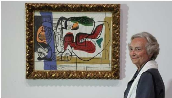
La Colección Pilar Citoler se abre al público

0 Comentarios 0 Twitter 0 Recomendar 0 +1 0 Share