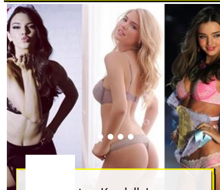
...ton, Kendall Jenner y