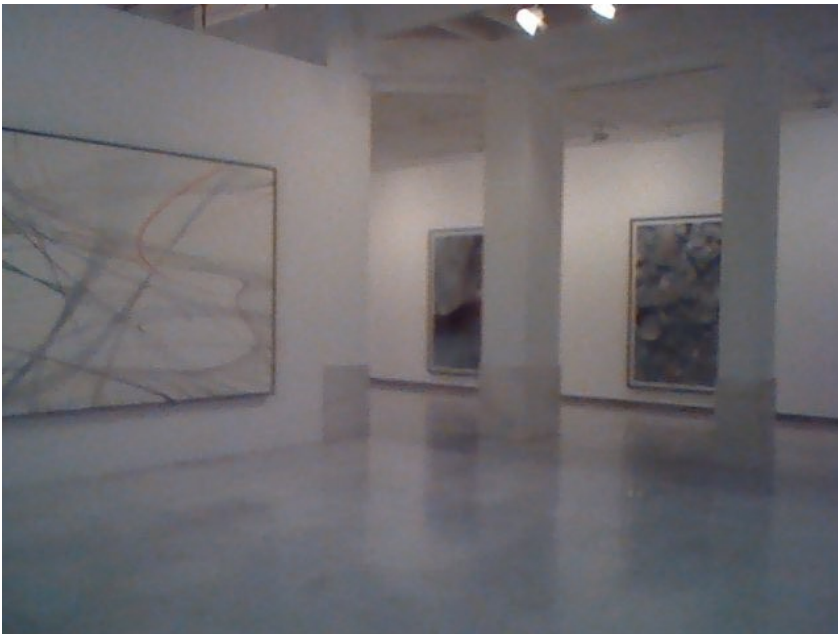
Exposición Thomas Ruff.

En total son sesenta imágenes de diversos formatos y tamaños que pertenecen a siete series en las que el autor utilizó diferentes métodos: 'JPEGs', 'Ciclos', 'Fotogramas', 'm.a.r.t.e.', 'Cassini', 'Noches' y 'Máquinas'.