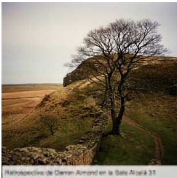
Retrospectiva de Darren Almond en la Sala Alcalá 31

La Sala Comunidad de Madrid-Alcalá 31 presenta a partir del 5 de junio, con la colaboración del British Council, dentro de la sección oficial de PHotoEspaña 2013, una retrospectiva de Darren Almond comisariada por Lorena Martínez de Corral y Santiago Olmo, en la que se traza por primera vez en España un recorrido sistemático por su obra, cuyo núcleo es 'All Thing Pass' (2012): una instalación articulada en cinco pantallas de proyección y rodada recientemente en Chand Baori (India), el mayor aljibe escalonado del mundo.